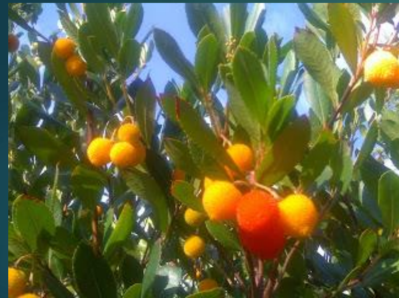
DRZEWO TRUSKAWKOWE – chruścina jagodna – (arbutus unedo) - κούμαρα