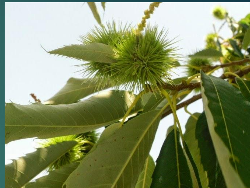
Kasztan jadalny - κάστανο