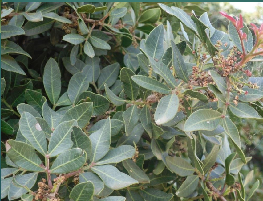
Drzewo mastyksowe - μαστίχα