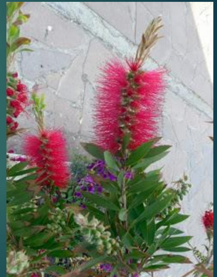
KUFLIK - KALISTEMON (CALLISTEMON ΚΑΛΛΙΣΤΗΜΟΝΑΣ)