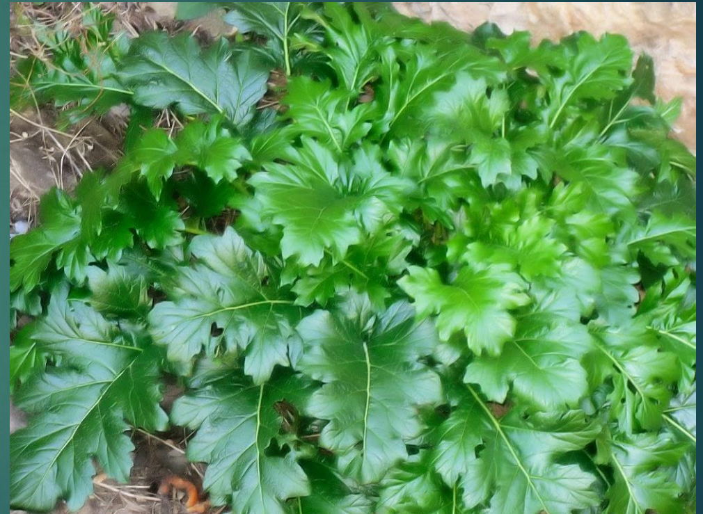
Akant - Ἀκανθός

Grecki architekt Kallimachos, który żył na przełomie V-IV w. p.n.e. postawił kosz z kwiatami na grobie swojej ukochanej córki. Kiedy pewnego dnia przybył na grób córki, zobaczył, że wokół kosza wyrósł akant. Artysta był tym tak poruszony, że wyrzeźbił liście akantu na głowicy kolumny. Tak powstał nowy styl w architekturze, zwany korynckim.