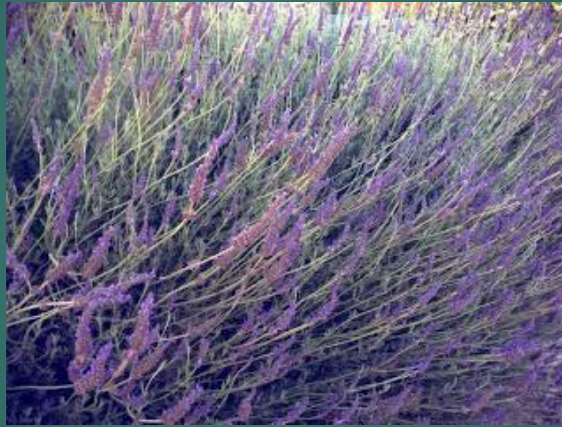
LAWENDA - λεβάντα