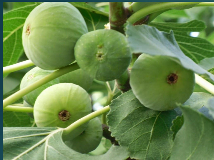
Figa - συκιά